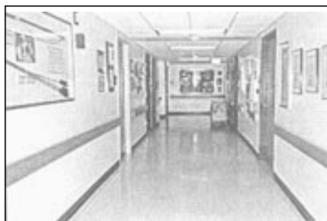
Fig. 15 b). Entrada a la Unidad de Quemados del Hospital Shands (EUA)