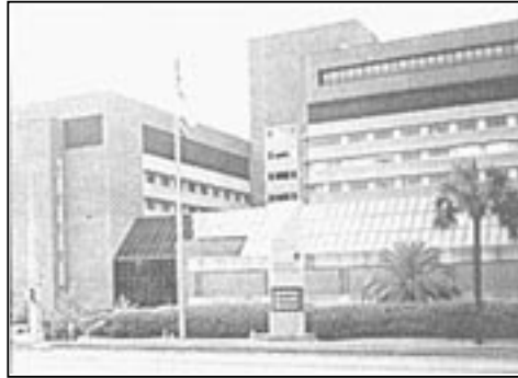
Fig. 15 a). Frente del Hospital Shands en la ciudad de Gainesville en el Estado de Florida (EUA).

su techo “muchos llegan a graduarse en Master” resaltó la enfermera para hacer hincapié en la formación profesional.