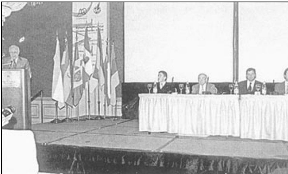
Fig. 12. Homenaje al Prof. René Artigas.

Finalizó recordando que este trabajo en conjunto afianzó una amistad que se ha mantenido por más de 50 años.