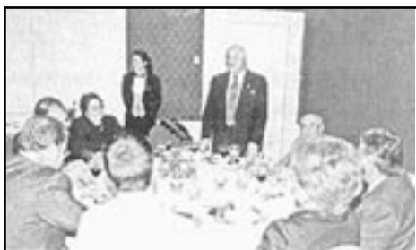
Figs. 10 a y b). Agasajo ofrecido a los profesores invitados extranjeros durante el Symposium Mundial Quemaduras 2000.

Además en salones del Hotel Intercontinental, se ofreció una cena patrocinada por los laboratorios Johnson & Johnson de la que participaron los invitados extranjeros y especialistas argentinos (Figs. 10 a y b y 11)