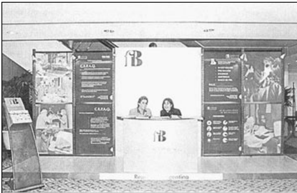
Fig. 13. Stand de la Fundación Benaim en el Symposium Mundial Quemaduras 2000 realizado en el Hotel Intercontinental de Buenos Aires.

ción se exhibió el nuevo modelo de la cama especial para quemados y el nuevo sistema de traslado, original del Dr. Fortunato Benaim, fabricado por la empresa argentina Manfredi (Fig. 14)